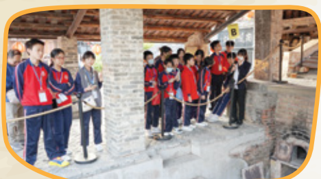
參觀超過500年歷史，用來燒製陶瓷的南風古灶。