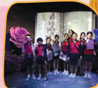
學生第一次參與沉浸式藝術體驗活動