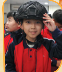
看看我戴上警察頭盔！像個警察嗎？