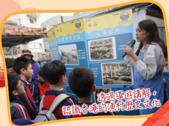
透過導遊講解， 認識香港的漁村歷史文化