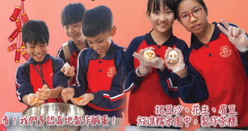
看！我們多認真地製作鹹蛋！