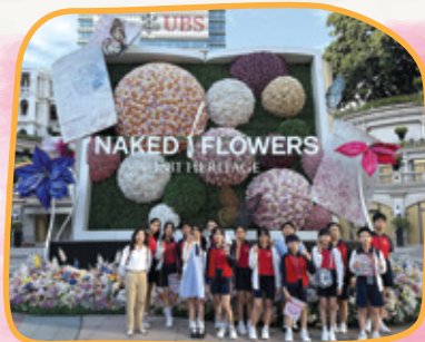
大家被層層的花海吸引

視覺藝術拔尖組於10月25日參觀NAKED FLOWERS花舞光影展。該展覽是以花卉作主題的沉浸式五感之旅，學生透過視覺、聽覺、觸覺、嗅覺、以至味覺帶來多重感官藝術體驗。同學如走進超越現實的魔幻花朵之境，沉浸於繽紛的花花世界中。