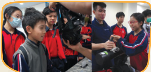
經過警官的介紹，我也想試試他們的裝備。