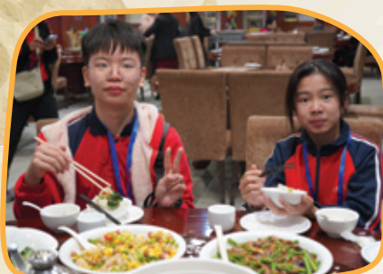
學生品嚐特色嶺南風味午餐。

遊歷佛山愛國心，南風古灶韻味長。 祖廟莊嚴工藝美，粵劇婉轉聲繞梁。 嶺南天地福吉祥，黃飛鴻館武宏揚。 石灣陶藝最精湛，廣小師生情永長。