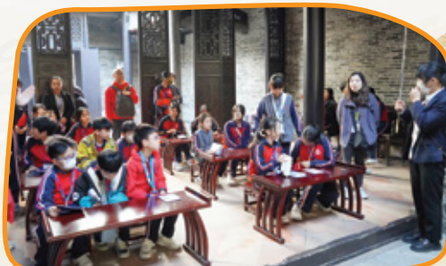
學生在祠堂的書室，了解古人上課的情況。