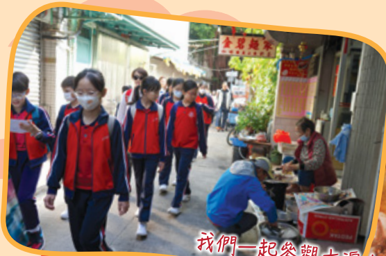
我們一起參觀大澳大街