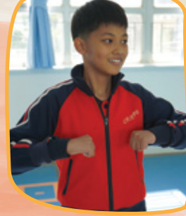
我的街舞舞姿，你們覺得怎樣？