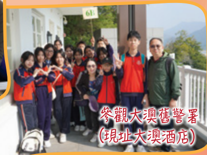
參觀大澳舊警署 (現址大澳酒店)

為了讓學生有機會接觸和欣賞大自然，放鬆平日緊張的學習情緒，舒暢身心，亦讓他們認識香港的漁村歷史文化，本校與青年漁港文化傳承協會有限公司在12月6日參與大澳歷史文化之旅。