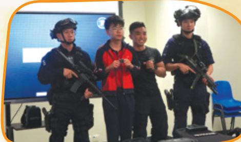
同學答對了問題，得到紀念品之餘，更和三位警官合照！

12月12日，我們有幸能到機場警署參觀。經過警官的介紹，我們對機場特警的裝備及他們日常的工作有更深的認識。我們有機會試穿他們部份的裝備，更能近距離觀看甚至觸摸他們的槍械。最後還有特警平日操練及警犬搜查示範。當天我們真是獲益良多。