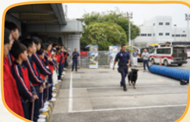
警官和警犬多合拍啊！