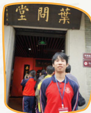
參觀祖廟內的葉問堂，認識一代武術大師——葉問的生平事蹟。