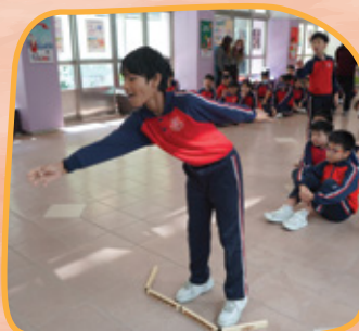
看我玩芬蘭木棋有多投入！