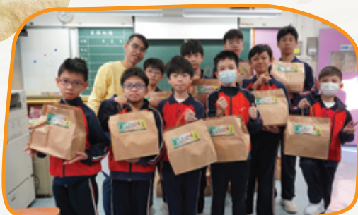
我們領取了早餐，真期待一會兒「開餐」！

本校參加由保良局主辦的「營動新世代PLUS」計劃，透過「早餐行動」及「營動工作坊」，前者為學生提供營養早餐及食物營養資訊，後者則讓學生體驗芬蘭木棋及街舞，並參與營養講座及親自下廚，製作有「營」食物，並將於來年舉辦「營動運動會」，計劃旨在推廣養成健康生活習慣的重要性。