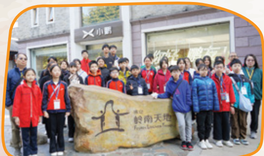
參觀佛山嶺南天地古建築群。