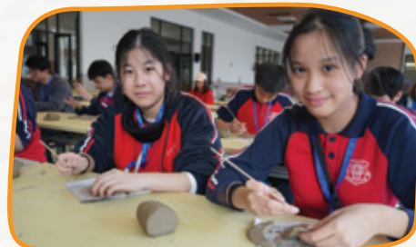
學生在石灣陶瓷博物館，體驗陶藝設計的過程。