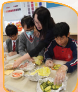
張主任和我們一起弄三文治