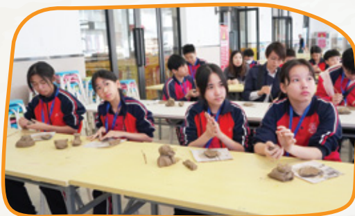
同學專心聆聽陶藝老師的講解。