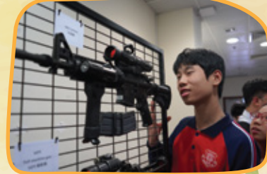
我對槍械都很有興趣呢！