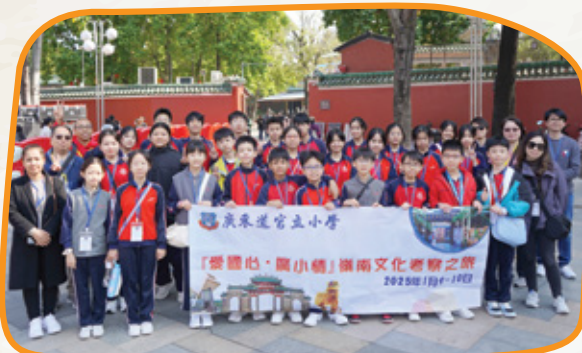
佛山祖廟參觀前大合照。