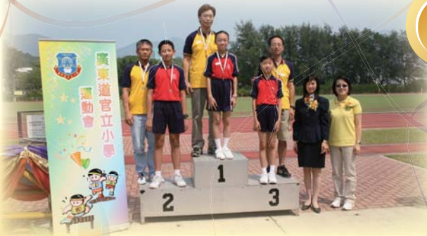
「親子接力賽」得獎者合照

剛開始宣誓時，我們有點不齊整，但慢慢我們便投入其中，自信也慢慢的表現出來了。宣誓儀式完結後，我像放下一塊大石般輕鬆。雖然來年我已不能參加廣東道官立小學的運動會，但在此，我祝願來年的宣誓運動員比我們做得更好。