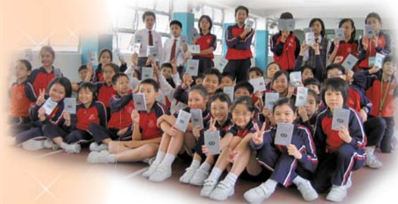
我們是今年新加入CVC的新力量。

自去年成立至今，已有超過一百位的團員。一如過往，本團今年將會參與各種公益和服務社區的活動，如慈善花卉義賣、慈善清潔運動以及探訪護老中心等。藉以發揚公益少年團熱心公益、服務社會的精神。