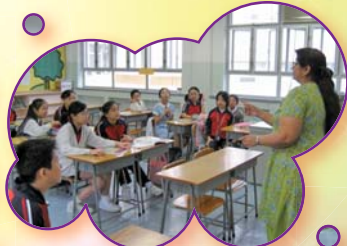
聽講英語好容易， 書寫文章真意思。