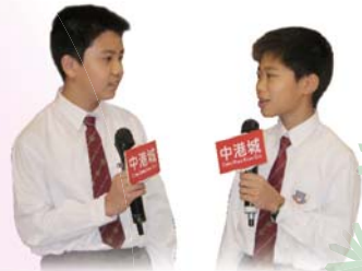
司儀談吐溫文，同學表現出色。