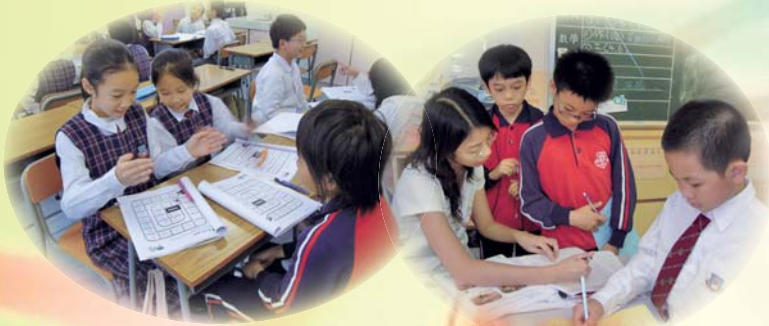
在夢幻英語教室中，學生全身投入英語學習活動。

本校與基督教勵行會合辦《課後探索之旅》計劃，為學生提供課後功課輔導及英語增潤課程，提升學生的學習效能，上學期開辦了課後功課輔導班及夢幻英語教室。自參加計劃後，學生對學習的信心增加不少哩！