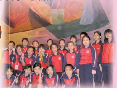
沙田大會堂那幅色彩繽紛的巨型 牆畫，顯得我們十分渺小嘍！