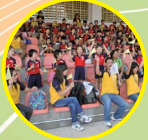
家長投入齊打氣，孩子信心定倍增。