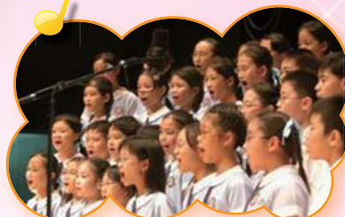
才藝大匯演，專業表演人稱讚。

星期二課後，合唱團都會留在音樂室練習。在訓練的過程中，同學不但唱出優美的歌聲，更能學到合作和守紀的精神。同學們每次均認真的練習，雖然間中都會埋怨辛苦，但他們都明白這是意志的磨練與決心的培養。所以，合唱團每次都有超水準的演出。