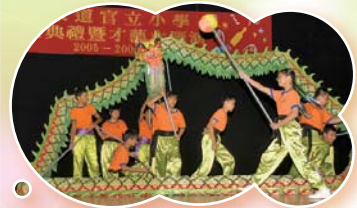
團隊合作見互信，舞動金龍顯實力！