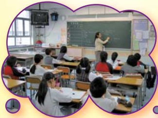
細心思考和析， 與數題目不困難。

本年度週六尖子班分別有「奧林匹克數學培訓班」及「劍橋英語班」。同學們完成課程後將參加不同的比賽，透過這些拔尖課程，同學們不但夠提昇個人的能力，亦為將來的學習打好基礎。