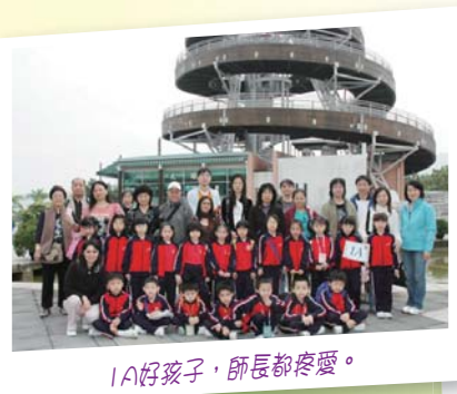
IA好孩子，師長都疼愛。