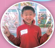
「共融、明天」繪畫填色比賽得獎學生