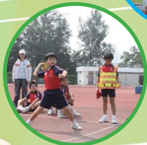
姿勢富力都強勁， 奪項冠軍定是我！