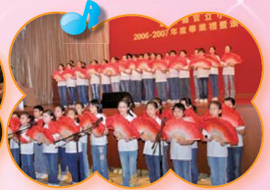
揮動彩扇，歌聲動聽！