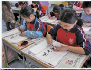
靜心專注寫書法，一手好字悠然生。