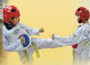
巾幗不讓蘇眉，看我多威風！

每星期二是「普通話日」，以「請說普通話，開口就合格」為口號，當值老師使用普通話作小息廣播，以營造普通話氣氛。小孩愛玩，新鮮，刺激，我們就抓住兒童的這個心理需要，每逢星期二的小息，普通話大使會帶領同學進行不同形式的活動，例如：飛躍舞台、現場遊戲、唱歌等。這些都讓同學發揮多元智能，在活動中使用普通話。