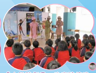
『大網路劇團』的表演讓我們學會了正確的理財方法。