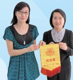
廣小學生與作家有個約會

為了提供多元化的校園生活，本校舉行一連串富有教育意義的講座和話劇表演。此外，為配合教學課題，老師會帶領學生走出課室，到不同的地點參觀。