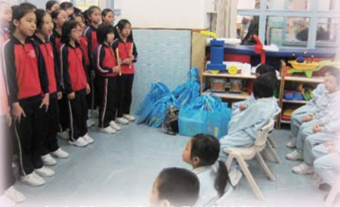
小孩子細心欣賞，同學們落力獻唱。

聖誕節乃普天同慶的日子，本校同學除了在參加學校旅行及聖誕聯歡會外，亦希望藉著他們動聽的歌聲帶給大家歡樂。因此，學校合唱團和牧笛隊於聖誕期間到了中港城商場、深培幼稚園及救世軍海富幼稚園報佳音，好讓大家一起分享聖誕的喜悅。此外，於聖誕聯歡會當日，本校舉行了「我最喜愛的聖誕樹」填色比賽頒獎禮，是次比賽共有超過八百位本區幼稚園學生參加，能脫穎而出獲獎的學生喜上眉梢。