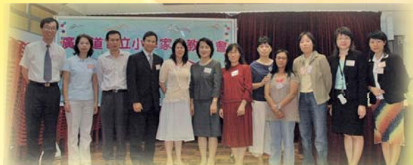
校長與新一屆委員大合照。