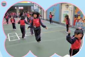
週三齊來學跳繩，新穎花式人讚好。

跳繩是一項強心健體的普及運動。跳繩沒有場地、人數及時間限制，適合同學課餘參與，藉此強健體魄。本年度學校定星期三為「跳繩日」，學校跳繩隊隊員會於小息時段教授低年級同學一些跳繩花式。