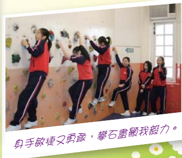
身手敏捷又勇敢，攀石盡顯我毅力。