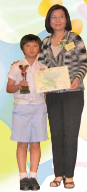
香港珠算協會會長李霞秋頒發獎項給本校學生代表

本校學生在「世界環境日2007」——「為藍天打氣」創意劇劇本大賽中取得「創意解難金獎」（小學組），學生透過話劇宣揚保持空氣清新的訊息。