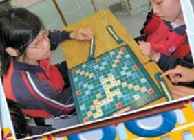
英語遊戲常常玩，聽說能力漸提高。