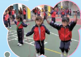
我要跳得比你高，每天練習定做到。