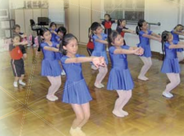
看！我們的舞姿多美妙！