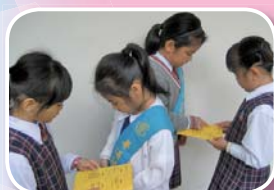
普通話大使，我的普通話標準嗎？

另外，為了提高學生說普通話的信心，我們更設計了「普通話課堂用語」和「普通話護照」。我們圍繞不同的學習主題，擬定了有趣的對話練習和多元化的朗讀練習，由普通話大使鼓勵同學多說普通話，為推動普通話設下基礎，增強大家說普通話的信心和能力。