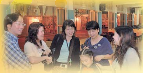
教師在輕鬆的氣氛下，與家長詳談。