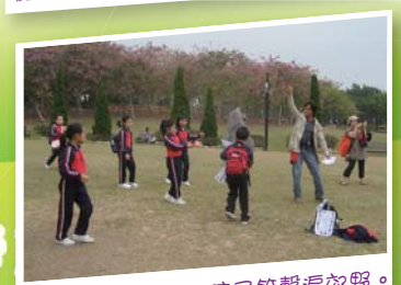
爸爸風箏放得高，孩子笑聲滿郊野。