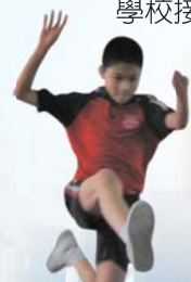
跳遠難度高， 手脚協調我做到。

田徑隊分別於星期一、三及五課後進行不同的田徑項目訓練，為學界田徑比賽作出準備。此外，學校接力隊亦不時獲邀參加校外比賽，成績優異。