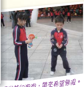
噴出夢幻泡泡，帶來希望無限。