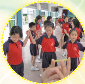
看！我們發揮合作精神，進行「反轉飲管」的遊戲。

本年度的風紀培訓班於十月十三日（星期六）舉行，共三小時。導師透過帶領風紀參與三個不同的遊戲，包括「網中人」、「反轉飲管」及「香蕉樹斜塔」，並進行討論，再配合導師的指導與分享，提昇了風紀生的溝通技巧、團隊精神以及解決問題的能力。