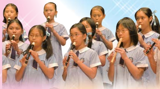
指尖跳動，奏出妙韻。

我校幼童軍於2007年7月21至22日參加了露營章訓練。在訓練營中，他們與其他旅團的幼童軍一起學習紮營、簡單的先鋒工程和戶外烹飪等技能，並發揮童軍盡所能、相幫助的精神，充實地渡過了兩日一夜。