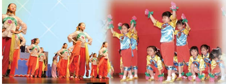
高級舞蹈團，技巧高超人標緻！

學校舞蹈團成立多年，每年均在學校舞蹈節比賽中獲獎，亦多次獲邀作公開演出，深受各方讚賞。