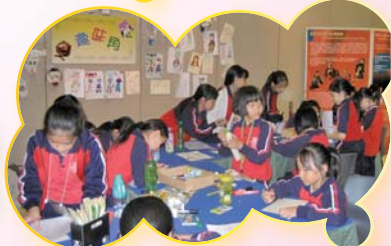
我們在展覽場館做甚麼？ 製作自家設計的木偶呢！

每位組員在視藝方面均有卓越表現，在老師的悉心帶領下，組員的創作技巧和興趣不斷提升，更代表學校參與各項校外比賽；他們亦不時出外參觀不同的藝術展覽，放眼來自世界各地或本地藝術家、其他學校同學的藝術作品。