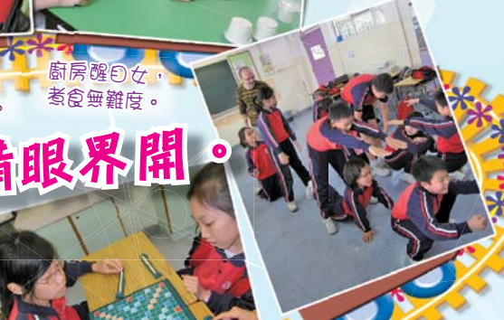
形態動作顯我意，英語話劇考心思。