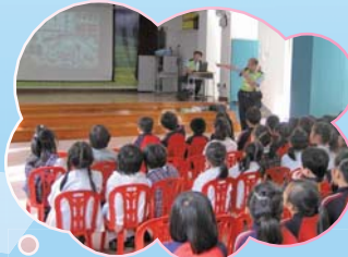
我們定要聽從交通警員的教導，注意交通安全。