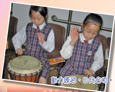
勤力練習，自覺合拍。