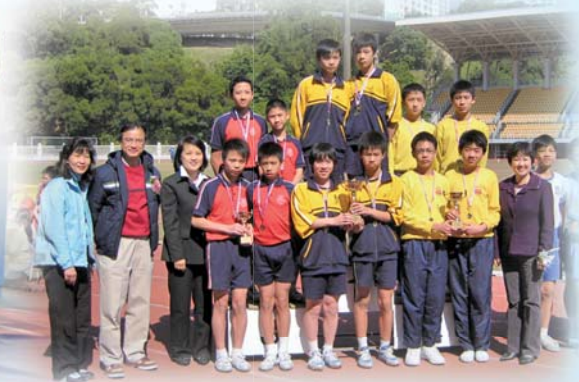
勤練見默契，奪獎亦輕易。