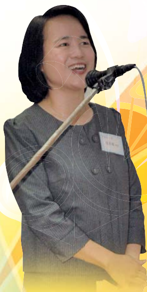
張校長在大會上致辭。

本年度家長教師會會員大會於十月二十六日（星期五）下午六時三十分於本校禮堂隆重舉行，內容包括會務報告、財務報告、新一屆委員選舉及安排家長與教師茶聚等，場面十分熱鬧。