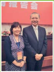
吳丹主任與教育局局長梁明揚先生攝於人民大會堂新聞發布廳內。

本年度的國慶節期間，本人有幸獲得香港教育局的邀請參與了第二屆「香港教育界國慶訪京暨專業交流團」（後簡稱訪京團）。是次的訪京團活動約有二百人參與，目的是希望讓香港的校長及教師更深入了解國家在教育事業方面的發展情況。