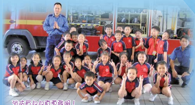
消防員叔叔真勇敢啊！