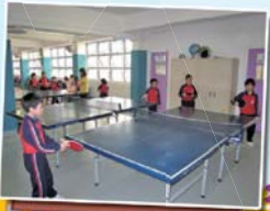
乒乓球考反應，球技精湛是精英！