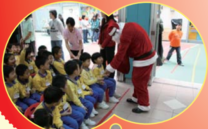
高唱聖誕歌，愛心畫發放。