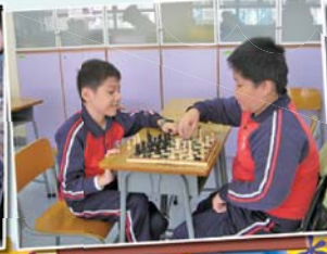
棋藝我最精，思考耐性我最勁。