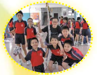
這棵運用報紙建造的香蕉樹多高嘍！