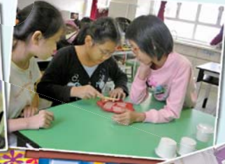
廚房醒目女，煮食無難度。