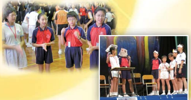
“Here we go! Go! Go!” Students were ready for the “Slogan Competition”.

On 27 th November, twenty-five students were invited to join the “English Day Camp for P.6 Students”, which was held at Shatin Pui Ying College. Students from different primary schools were divided into several groups. They were guided and led by the camp leaders who were students of the senior secondary level. Some of them were exchange students from overseas too. Throughout the camp, students had to use English as the sole language to make friends and play different kinds of interactive games. By the end of the camp, they had to work with others to perform a drama on stage as a contest. Most of our students participated actively and enthusiastically and they did, showed their confidence and proved their competence in using English for fun, not simply in classroom routine or written assessments.