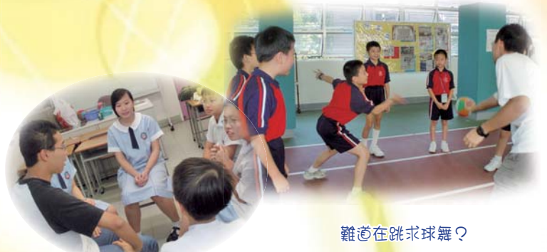
排排坐，吃粉筆？原來在玩7號數字遊戲，讓人緊張得磨拳擦掌呢！

是透過不同類型的活動和遊戲，提昇學員不同的能力及興趣，增加他們對學習的自信心，建立積極的人生態度。