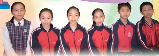
第五十九屆香港學校朗誦節比賽獲獎學生