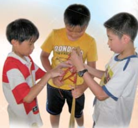
我們正在用竹枝和繩製作一個 晾衣架，看我們多認真！