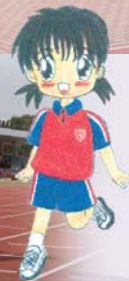
班際混合接力賽，團隊合力定取勝！