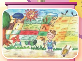
江譚頤的冠軍作品