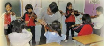
老師很用心指導我們嘍！