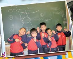
彩珠串飾，男孩子的作品也不錯呢！