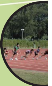
校長主持起，激烈賽事連。