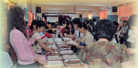
大會預備了豐富的茶點讓家長和同學享用。