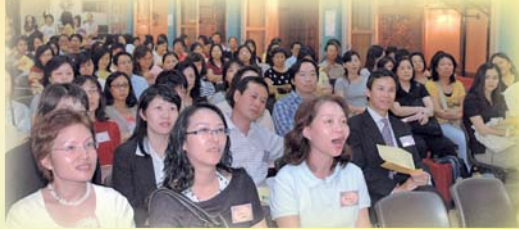
家長踴躍參與大會，座無虛席。