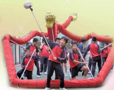
練習一絲不苟，隊員合作無間。

廣小龍隊已成立3年多了，過去多次於學校才藝匯演中演出，表現大獲好評，去年更獲全港舞龍比賽優異獎。本年度龍隊已開始為3月之全港比賽作出訓練，隊員們的表現非常合拍，充份顯現團隊精神。