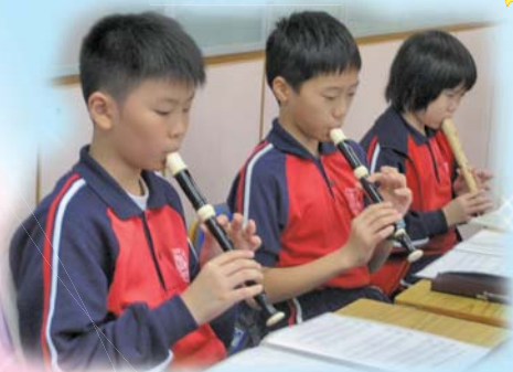
專注訓練，笛聲柔柔。