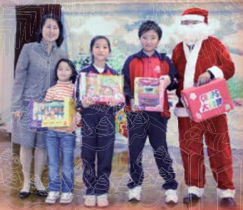
抽獎節目人興奮，同學獲獎展笑臉。