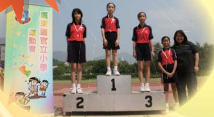
女子一百米賽事得勝者

今年，我獲得女子一百米冠軍，雖然賽前我的信心不大，而且非常緊張，但當一踏上賽道，我便充滿力量，加上看台上同學們支持吶喊，我終於成功衝過終點，取得勝利，真有點意想不到呢！我會繼續努力練習，希望在學界賽事中爭取更好的成績。