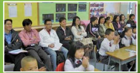
港澳信義小學的十一位數學科老師到本校進行觀課和交流。

除了與內地、澳門和台灣的數學教師有交流的機會之外，本人於十月三十日和十一月十二日亦分別與農圃道官立小學和港澳信義會小學的老師作主講及分享本人在數學科的專業心得，並在廣小進行了兩節數學科示範課。在這兩次的專業交流活動中，我們不但就著數學科科本的問題作深入討論，還就著學生在學習數學時所面對的難點及有關的解決策略交流心得。雖然兩次交流的時間都只有短短的三小時，但彼此間坦誠、積極和有效能的溝通卻使本人獲益不少了呢！