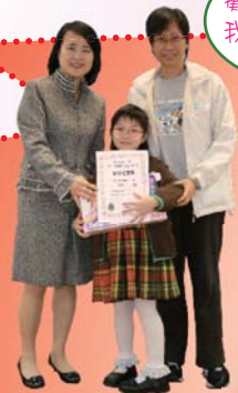
恭喜獲獎的幼稚園學生！