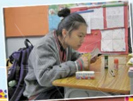
細心製作紙模型，精緻作品由我作。