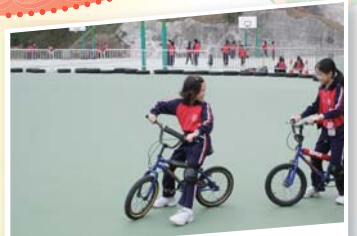
好友同行踏單車，郊野遊玩樂逍遙。