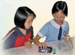
我們正在仿畫蓋克大師的名作——吶喊。

今年度的課後興趣班多姿多采，包括弦樂班、跆拳道班、繪畫班、聲樂班和中國舞班。學生在當中盡展所長，培養興趣，藉此發展多元智能。