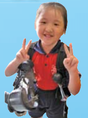
我的消防裝備可真重呢！

為了提供多元化的校園生活，本校舉行一連串富有教育意義的講座和話劇表演。此外，為配合教學課題，老師會帶領學生走出課室，到不同的地點參觀。