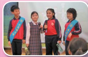
普通話大使於普通話日積極推動同學聽說普通話。