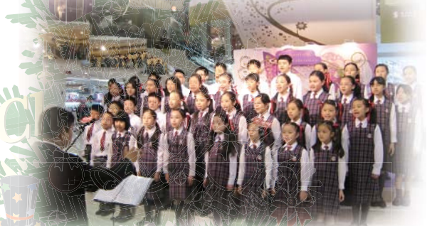
廣小合唱盡精英，聖誕佳音聲柔柔。