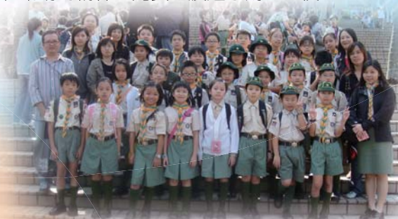
11月4日是童軍大會操暨童軍百週年紀念， 我們懷著興奮的心情參與是次慶典。